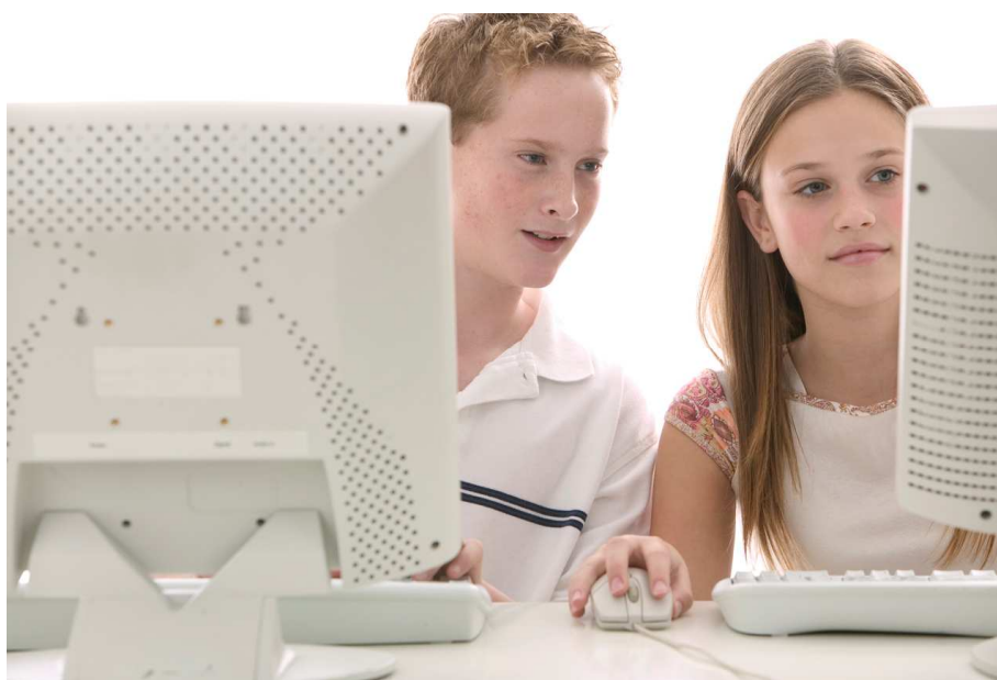
Proyecto CiberCaixa “Quedamos al salir de clase”